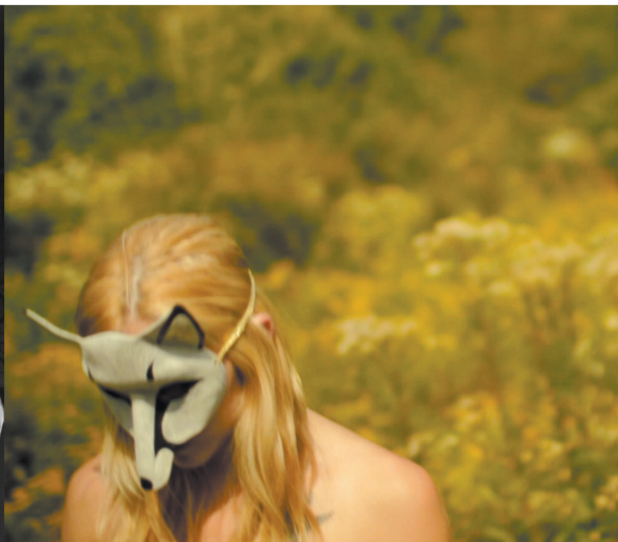
Dziewczyna w masce lisicy / White Fox Mask reż. Ricky Shane Reid