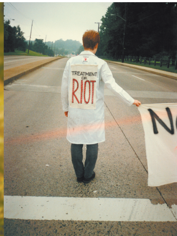
Jak przetrwać epidemię / How to Survive a Plague reż. David France