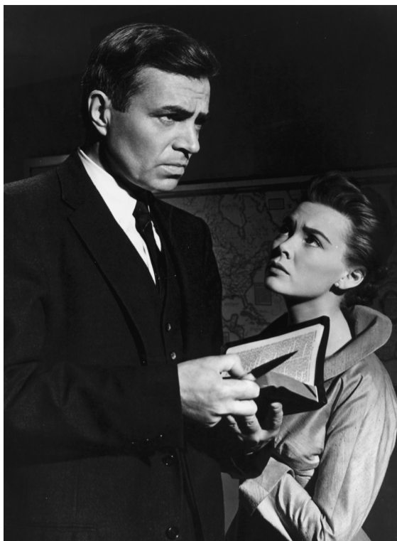
Życie na szali / Bigger Than Life reż. Nicholas Ray