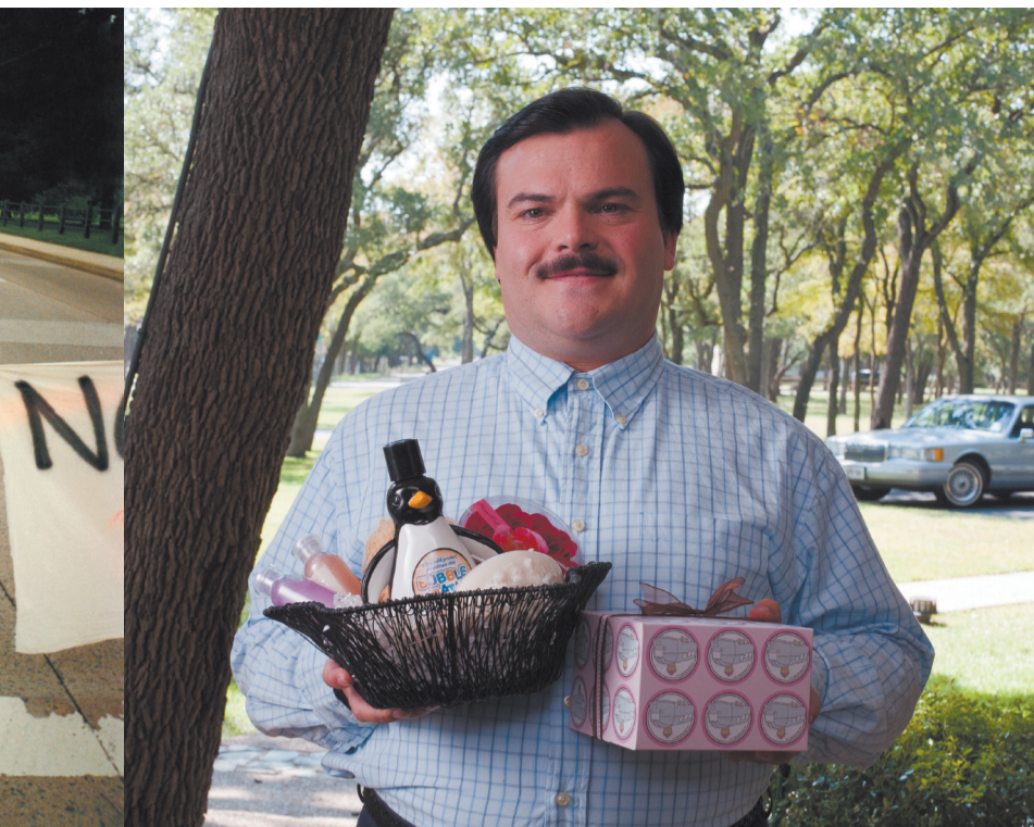
Bernie reż. Richard Linklater